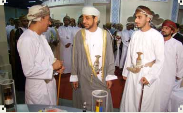
معالي وزير الإعلام يتحدث مع الفاضل نائب رئيس مجلس الإدارة وهو يستمع عن تاريخ الشركة