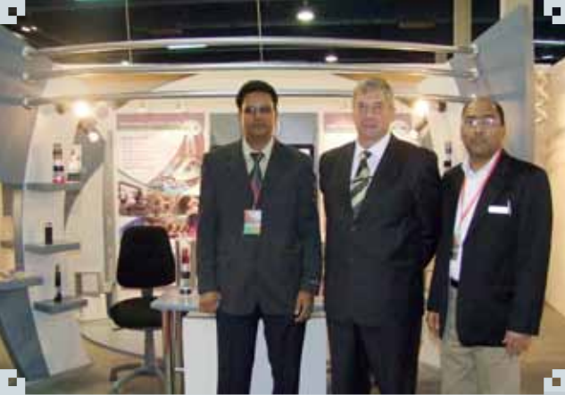
معرض إنجازات عمان مركز المعارض، يناير ٢٠١١