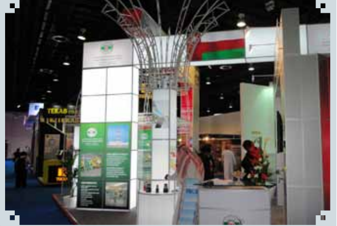
معرض كهرياء الشرق الأوسط في دبي ٨ - ١٠ فبراير ٢٠١١