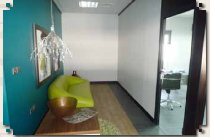
نظرة على المكاتب العصرية

الفاضل كريستيان ارنست سكوت القائم بأعمال الرئيس التنفيذي لشركة صناعات الألمنيوم التحويلية