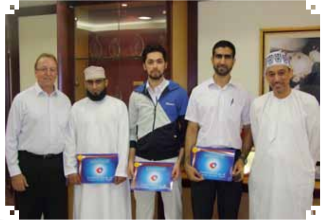
قامت غرفة تجارة وصناعة عمان مؤخراً بتنظيم ندوة عن مهارات القيادة والقياديين. إدارة الشركة تساند مثل هذه المبادرات التي تساعد الشباب لنيل مناصب قيادية في المستقبل.