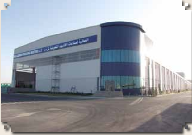
المصنع من الواجهة الأمامية