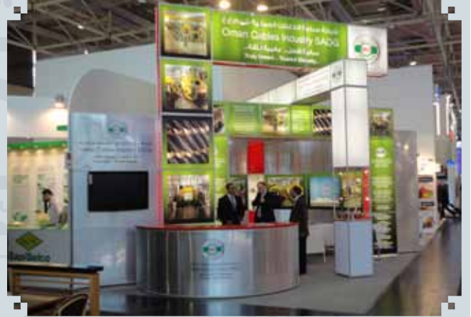
معرض هانوفر ميسي - ألمانيا ٤ - ٨ إبريل ٢٠١١