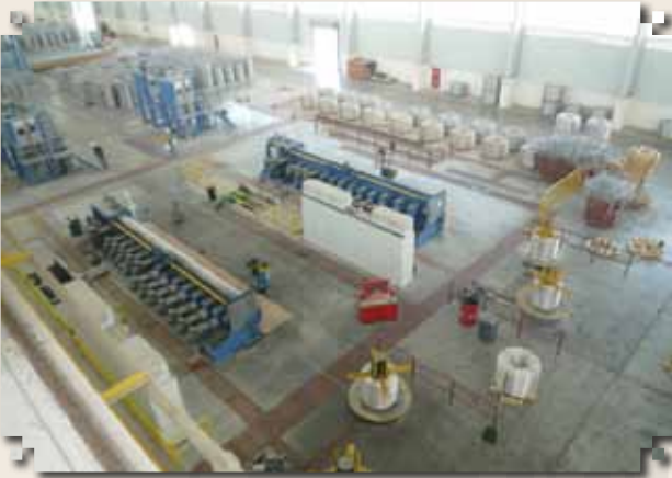
منظر علوي - داخل المصنع

مشروع مشترك بين شركة الكابلات العمانية وشركة تكامل للاستثمار