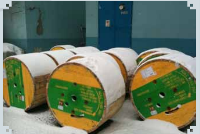
من البلاد الحارة إلى البلاد الباردة، تركيا.